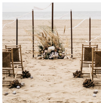
Rentals + Floraldesign